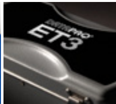
Barrera térmica TB0263*