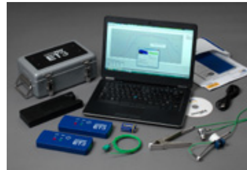
Sistema DATAPAQ EasyTrack3