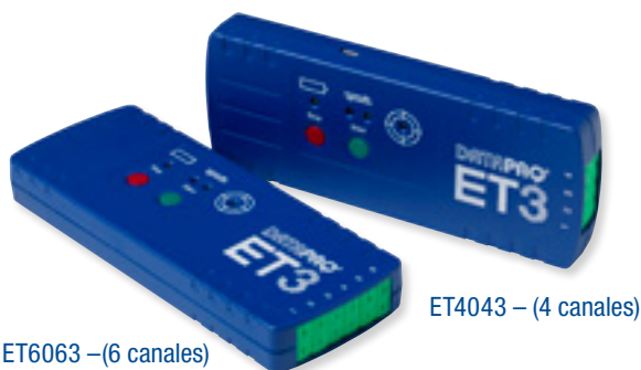
ET4043 – (4 canales)